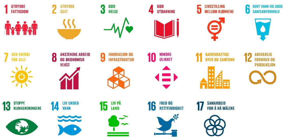
Figur 2.1 FNs bærekraftmål. Figuren er hentet fra https://www.fn.no/Om-FN/FNs-baerekraftsmaal

Bærekraftmålene utgjør den overordnede innrammingen av transportvirksomhetenes besvarelse av dette oppdraget, og vi har hatt som mål å synliggjøre hvordan samferdsel og mobilitet er relevant for å bidra til oppfyllelsen av målene.